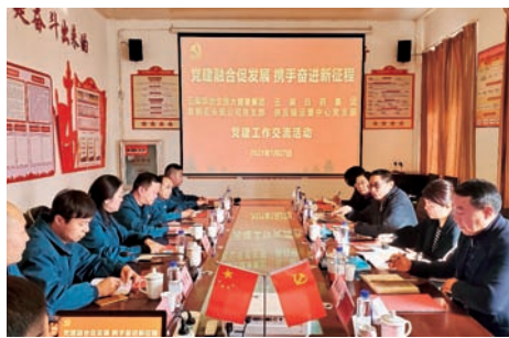
(供应链运营中心党支部)

限公司是云南白药包材的长期优质供应商，双方物资采购方面已进行多年友好合作。交流会上，双方党支部代表介绍了各自党建工作的基本情况并互相学习研讨，结合业务工作实际交流意见建议。脚踏实地的分享交流进一步增进了两个业务部门间的了解，为后期更为高效的合作共赢起到了积极促进作用。双方将以共同的初心和使命，加强与业务合作的深度和广度，凝心聚力，创新发展。